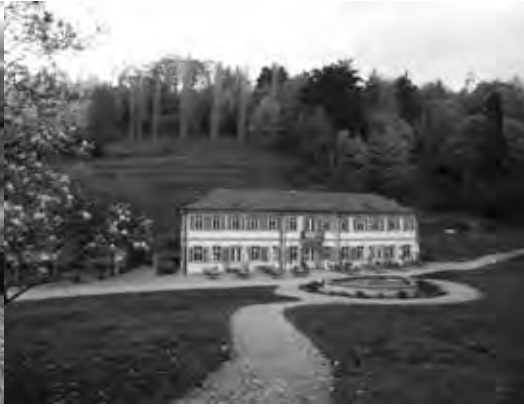
Herrenhaus mit Herrenwiese und der Toskana ähnliche Landschaft im Hintergrund