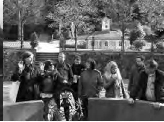
Teil der DLH-Gruppe am Gesundbrunnen, Wachthäuschen im Hintergrund

Auf Einladung des Kreisverbandes Bergstraße-Odenwaldkreis des Deutschen Lehrerverbandes Hessen (DLH) besuchten am 26. April 2016 Lehrerinnen und Lehrer verschiedener Bergsträßer und Odenwälder Schulen gemeinsam den Staatspark Fürstenlager in Bensheim-Auerbach. Bei überwiegend sonnigem Frühlingwetter informierten sich die Lehrer auf einem Rundgange über die pädagogischen Möglichkeiten, die sich bei einem Parkbesuch mit Schülergruppen eröffnen.