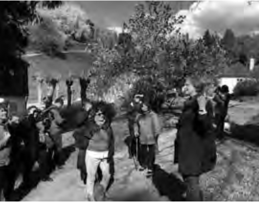
Teil der DLH-Gruppe am Magnolienbaum